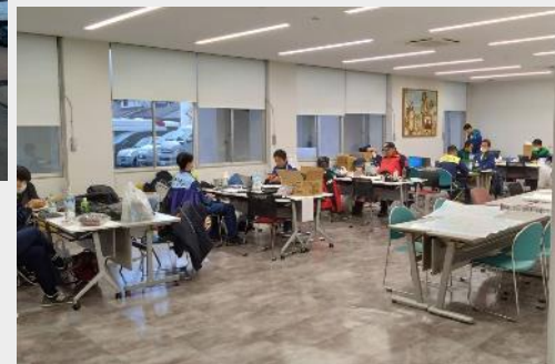
統括支援チーム活動状況